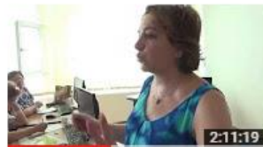
Școala de vară - Acces deschis și surse deschise pentru... 47 de vizionări • Acum 6 luni