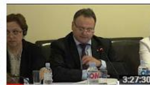
Conferința "Cartografiere pentru Revoluția Datelor în Republica..." 99 de vizionări • Acum 7 luni