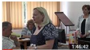
Școala de vară - Acces deschis și surse deschise pentru... 48 de vizionări • Acum 6 luni