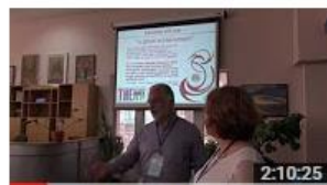
Workshopul profesional nr.2 „Advocacy. Marketing...” 26 de vizionări • Acum 7 luni