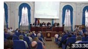
Raportului final de analiză și evaluare a sistemului actual al... 376 de vizionări • Acum 6 luni