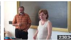
Școala de vară - Acces deschis și surse deschise pentru... 87 de vizionări • Acum 6 luni