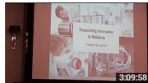
Sprijin pentru inovare în Republica Moldova 126 de vizionări • Acum 6 luni