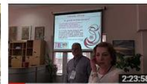
Workshop prof. nr.2 Advocacy.Marketing: promovar... 155 de vizionări • Acum 7 luni