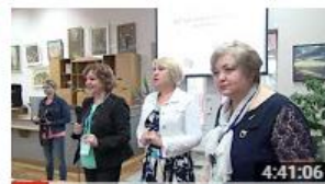
Workshopul profesional nr.2 „Advocacy. Marketing...” 124 de vizionări • Acum 7 luni