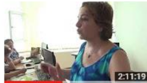
Școala de vară - Acces deschis și surse deschise pentru... 47 de vizionări • Acum 6 luni