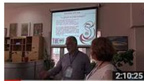
Workshopul profesional nr.2 "Advocacy. Marketing... 26 de vizionări • Acum 7 luni