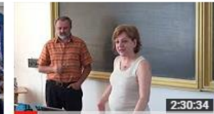
Școala de vară - Acces deschis și surse deschise pentru... 87 de vizionări • Acum 6 luni