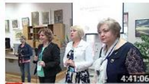
Workshopul profesional nr.2 "Advocacy. Marketing... 124 de vizionări • Acum 7 luni