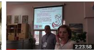
Workshop prof. nr.2 Advocacy. Marketing: promovar... 155 de vizionări • Acum 7 luni