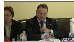
Conferința "Cartografiere pentru Revoluția Datelor în Republica... 99 de vizionări • Acum 7 luni