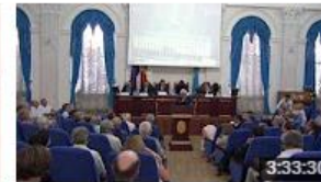
Raportului final de analiză și evaluare a sistemului actual al... 376 de vizionări • Acum 6 luni