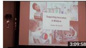
Sprijin pentru inovare în Republica Moldova 126 de vizionări • Acum 6 luni