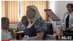
Școala de vară - Acces deschis și surse deschise pentru... 48 de vizionări • Acum 6 luni